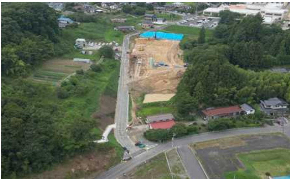
南側（ミニストップ側）から