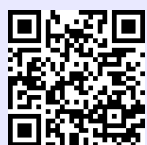
利用登録用フォーム