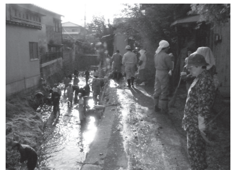
昨年のクリーンアップ作戦のようす