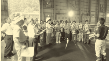
最終処分場の説明を聞く参加者

7月16日(木)朝9時、雨が降る中約40名の方が参加し、検証視察を実施。視察は、例年と同じく「三春町清掃センター」、「田村西武環境センター」、「常葉最終処分場」を巡るコースで、各処理場も、周囲環境への影響低減、設備の維持継続、処分場所の延命化の課題を抱えて対応している様子が、ひしひしと伝わってきた。大雨の中での熱心な説明と高度な内容の質問に何とか答えようとする説明員の姿が大変印象に残り、現在のゴミ処分環境を如何に「維持・継続」していく事が、大変に難しい課題であると、ゴミ排出の当事者である自分が問われたと感じた6時間だった。