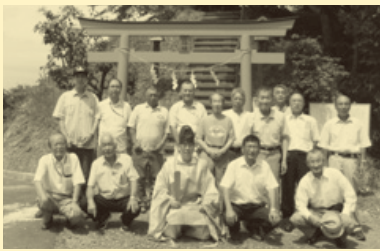
関係者で記念撮影

8月9日、下舞木集会所協の雷神様で関係者が集ってお祭を行いました。今年は鳥居を建替え説明パネルを直しましたので、地区の皆様ぜひご覧ください。