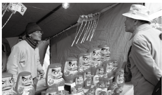
今年のだるま市のような