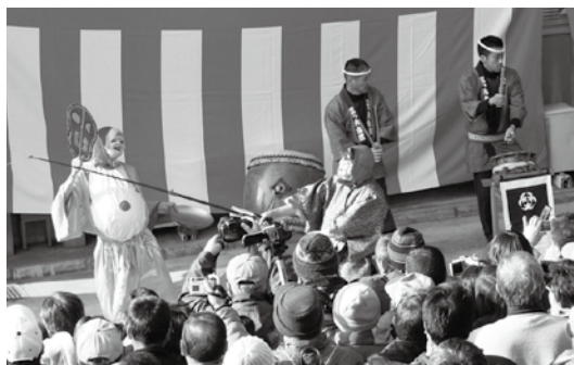
ひよつとこ祝い踊り