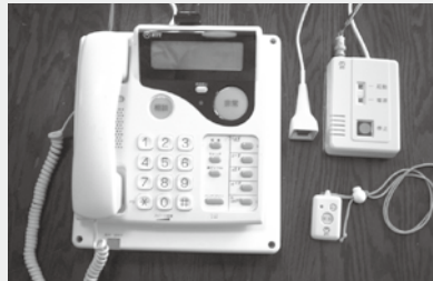
緊急通報システム電話機

緊急の際に電話機付属のボタンを押すだけで福祉会館（社会福祉協議会）に通報されます。