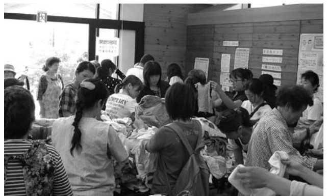
育児リサイクルのようす（駅前健康サロン）

駅前健康サロンは、水・土曜日を除く午前10時から午後4時までご利用いただけます。健康チェックや運動はもちろん、健康に関する情報交換など、ご利用法はさまざまです。「まだ行ったことがない」という方も一度足を運んでみてください。