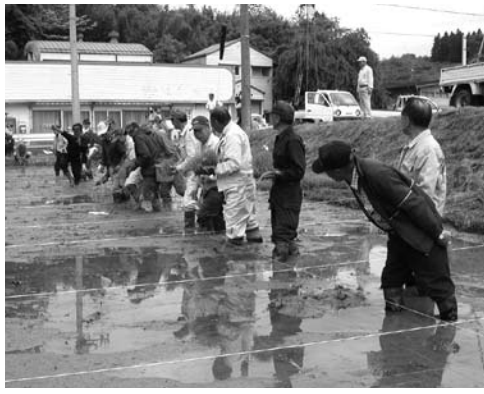
斎藤地区のみなさんで「たんぼアート」