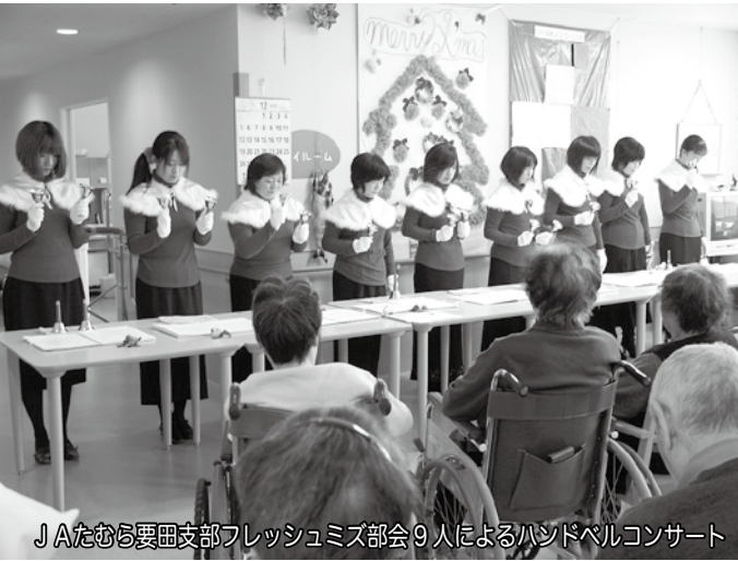
J A たむら要田支部フレッシュミズ部会9人によるハンドベルコンサート

新しい三春病院になって3回目の新年を迎えました。 三春町にお住まいの皆様の健康を守るために職員一同頑張っております。今年もよろしくお 願い申し上げます。