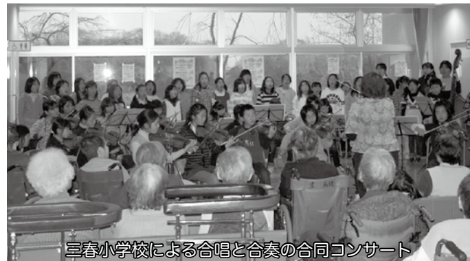
三春小学校による合唱と合奏の合同コンサート