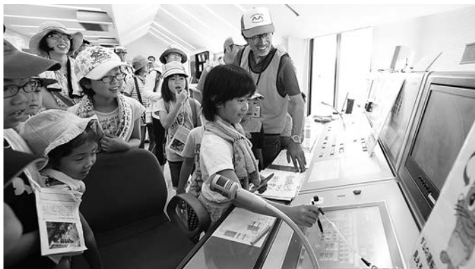
三春ダム見学の様子

参加者は各コースにわかれ、Eボートこぎやザリガニ釣り、カブトムシなどの昆虫採集を体験し、さくら湖周辺の自然に親しみました。また、三春ダム見学も行われ、ダム提体内やダム操作室の見学を行いました。三春ダムの仕組みや役割についても理解を深めました。