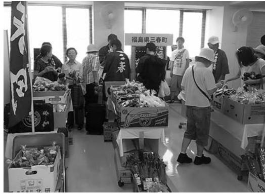
今年も賑わいを見せた商工まつり

7月26日・27日に、東京都目黒区において開催された目黒区商工まつりへ出展しました。今年はアイドルユニット「ALLOVER」と目黒区商店街連合会のゆるキャラ「スマにゃん」も参加し、猛暑の中たくさんの人で賑わいました。 三春かご市の協力をいただき、今年も三春産の野菜を心待ちにしてください。いる方へ、とれたて野菜を販売しました。 また、三春町で合宿を行っている目黒区剣道連盟の皆さんがお手伝いに来てくださり、交流を深めながら、三春町のPRを行いました。