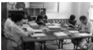
共同作業所 みはる工房