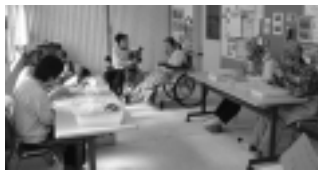
共同作業所 いちご