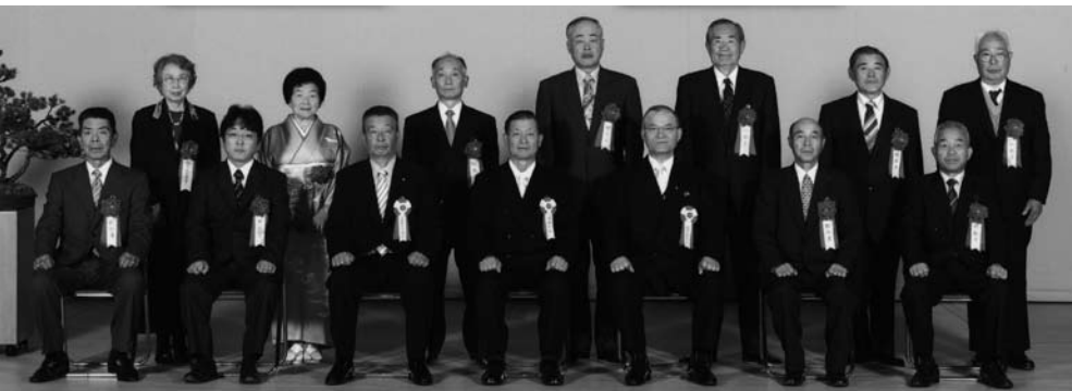
顕彰表彰・感謝状を受賞されたみなさん

(功績) 40年前まで続いていた御神講行列を平成17年に見事に復活させた。今年で4年目を迎え、氏子はもとより、地区内外からも行列に参加する人が年々増えている。地域の伝統芸能を若者が継承し、それをもとに地域の年代を超えた人々の交流が出来るようあり、その活動は他の模範である。