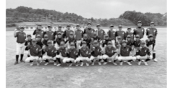
クラブチームの設立

問 運動部の部活動地域展開について、進行状況を教えてください。 生涯学習課長 運動部の外部指導者を登録する人材バンクを運用し、各競技に派遣しています。登録者は38名で、休日を中心に指導にあたっています。 問 働き方改革として教員の負担軽減につながっていますか。 生涯学習課長 休日の試合等の指導のみで行う部も増えているため、教員の働き方改革につながっていると考えています。 問 令和8年度以降の取組みについて教えてください。 生涯学習課長 外部指導者が人しかりい部活動があるので、指導者の確保を図ります。また、国の補助制度を十分に活用して、指導者の活動報酬費や指導者養成講習会の経費などにあて、地域展開を進めてまいります。 副議長 クラブチームの設立