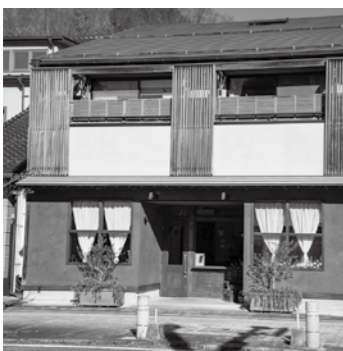
補助金を活用した店舗 (Albaro)

問 空き店舗活用において、営業日数に関する要件は規定していませんが、常時営業している既存店舗との公平性はありますか。 産業課長 新たな事業を始めたい事業者には、町から可能な限り営業日数を多くし、店を開けてにぎわい創出や利用者のニーズに添えていただければという働きかけを行っています。 問 3年間の家賃補助が終了した後も、継続営業している店舗を紹介してはどうか。 産業課長 三春町の補助金を活用した店舗についての紹介は可能と思います。実際に町内で空き店舗補助金を活用し、現在も事業を行っている店について情報発信していきたいと考えています。