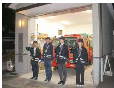
未来を担う団員にエールを