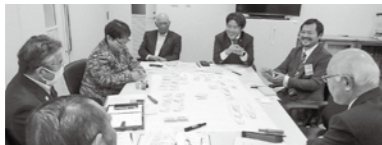
昨年の意見交換会