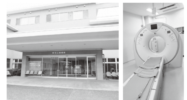
三春病院に残された稼働停止中のCT