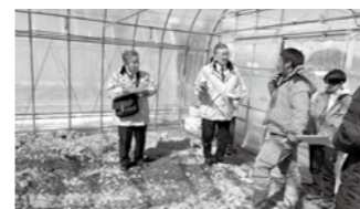
ガンバレ認定新規就農者

問 農業従事者の高齢化がすすむなか、全国でも65歳以上の農業者が6割を占めています。今後ますます耕作放棄地の増加や従事者の減少が心配されます。国では各種補助金、助成制度を作り支援制度を充実させていますが、認定農業者の資格取得が必要ですか。その要件は何でしょうか。 産業課長 5年後の年間所得が350万円、年間労働時間が1,800時間程度を目標とする農業経営改善計画を作成し、担い手等認定審査会において審査を行い認定を受けることとなります。 問 年齢制限、農地等の所有要件はありますか。 産業課長 ありません。 問 認定を受けた場合の助成策はありますか。 産業課長 農業機械の導入費用の補助などの支援制度が設けられています。 副議長 ガンバレ認定新規就農者