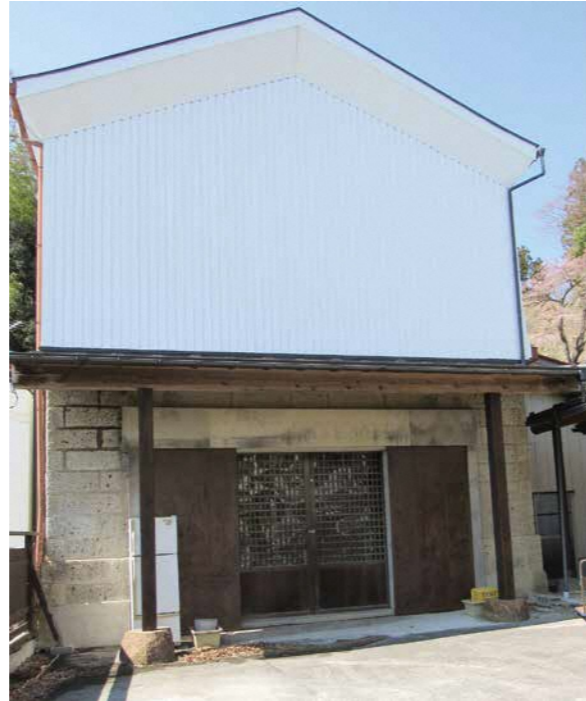
寄附を受けた北町の石蔵 交付金を活用します

議会では、にぎわい創出につながる取り組みとして期待する一方、将来的な維持管理費が町民の負担とならないために、適切な契約を結ぶよう意見を付しました。