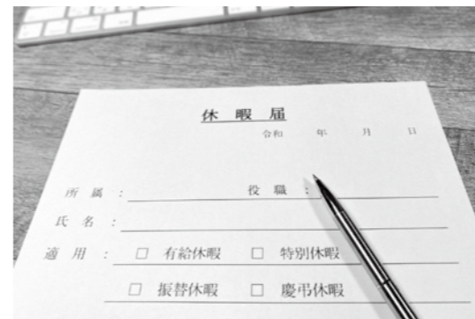
休暇を取りやすい職場環境へ

問 切捨てのないよう年休を取らせたい。年末に切捨てが残っているとすれば、年末から数えて約2週間、要するに「8日分あなたは休みなさい」と休ませる。そのことがあってしかるべきではないでしょうか。 総務課長 所属長と個人に通知しフォローアップしているところです。なるべく切捨てがないよう、今後取得できるようにしていきたいと考えます。