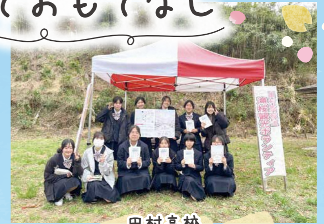
田村高校 「滝桜ボランティア隊」

昭和57年から続く「滝ザクラを守る会」は、中郷小学校として最後の活動になります。手づくりパンフレットの配布や敷地内のゴミ拾い活動をして、お客様に心を込めておもてなしをしています。