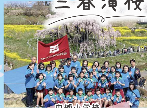
中郷小学校 「滝ザクラを守る会」

昭和57年から続く「滝ザクラを守る会」は、中郷小学校として最後の活動になります。手づくりパンフレットの配布や敷地内のゴミ拾い活動をして、お客様に心を込めておもてなしをしています。