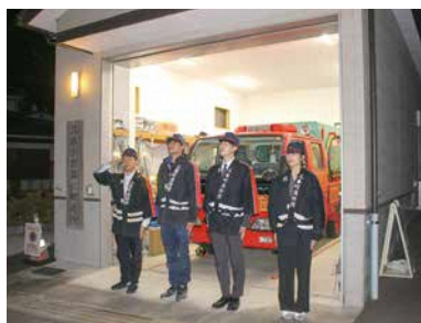
未来を担う団員にエールを