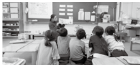
まほらっこ三春教室の指導員による本の読み聞かせ

児童クラブがないので、まほらっこ教室の時間延長や長期休業中の受け入れをしています。