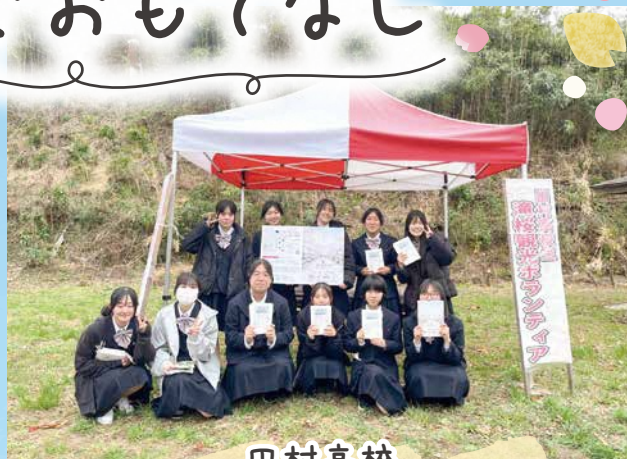
田村高校 「滝桜ボランティア隊」

昭和57年から続く「滝ザクラを守る会」は、中郷小学校として最後の活動になります。手づくりパンフレットの配布や敷地内のゴミ拾い活動をして、お客様に心を込めておもてなしをしています。