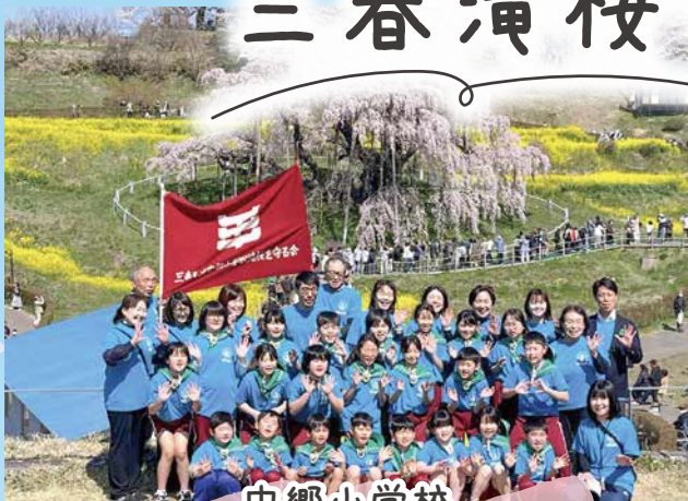
中郷小学校 「滝ザクラを守る会」

昭和57年から続く「滝ザクラを守る会」は、中郷小学校として最後の活動になります。手づくりパンフレットの配布や敷地内のゴミ拾い活動をして、お客様に心を込めておもてなしをしています。