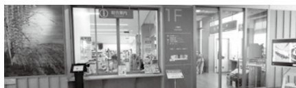
役場 | 階の総合案内

「すぐやる課」の設置は難しいですが、今後も町民の様々な要望に速やかな対応が出来るよう、人材育成と行政サービス向上に努めます。