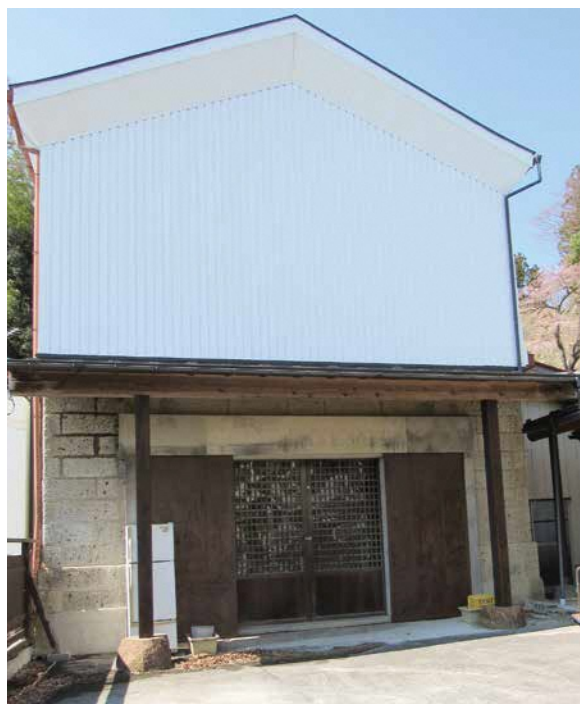
寄附を受けた北町の石蔵 交付金を活用します

専門家から助言を受け、自主的・主体的な地域づくりを推進する事業です。(28万円)