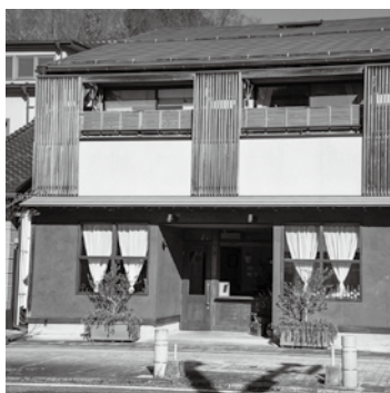
補助金を活用した店舗 (Albaro)

三春町の補助金を活用した店舗についての紹介は可能と思います。実際に町内で空き店舗補助金を活用し、現在も事業を行っている店について情報発信していきたいと考えています。