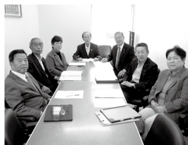
議会運営委員会のメンバー