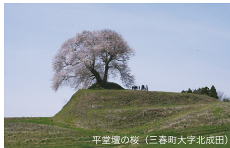
平堂壇の桜 (三春町大字北成田)

また、Instagram「みはるぐらし」の運営も担当していますので、ぜひ、ご覧ください！よろしくお願いいたします。