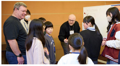
東京アメリカンクラブでの交流/青少年国際理解教育プログラム