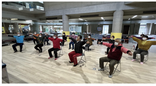
地域サロンでの活動