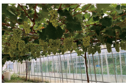
ハウスぶどう栽培