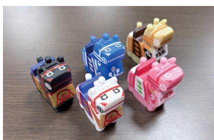
ぷかぷか三春駒の制作