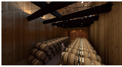
地域資源を活用したウイスキー貯蔵庫・イメージ