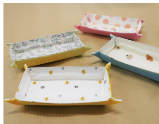
牛乳パックでトレイをつくろう！