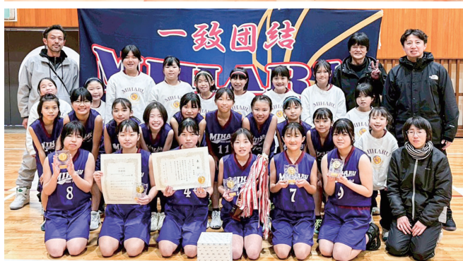
岩江ドリームバスケットクラブの皆さん