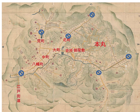
宝永4年(1707年)三春城下絵図 ● 城下町総門(木戸)