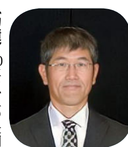
青石1区 様 (沢石)

〔功績〕平成25年から8年以上の長期にわたり、草刈り等のボランティア活動で桜川の環境美化に積極的に取り組んでいる。