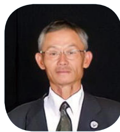
御木沢地区 まちづくり協会 様 (御木沢)

〔功績〕そうま道七草木塩街道を後世に残す遺産として平成20年から10年以上にわたり、古道の草刈りや保全整備を実施している。 この取り組みは、歴史遺産を残す取り組みとして文化活動に貢献している。