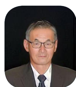
樋渡三匹獅子舞 保存会 様 (中郷)

〔功績〕270年以上にわたり三匹獅子舞を地域住民が協力し、伝統を継承している。子どもたちも地域の行事や伝統を受け継ぐことをよく理解し、積極的に活動することで、樋渡地区内の地域伝統芸能の継承と融和が図られている。