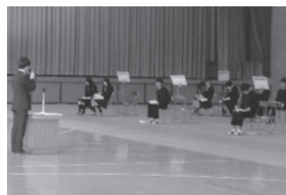
専門学校全体説明会

生徒たちは新社会人としての知識や技能を具体的に学び、元気の挨拶・時間や期限の厳守・清楚な服装や髪型の大切さなどを改めて感じ、働くことへの意識を高めた様子でした。