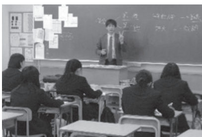
各私立大学説明会