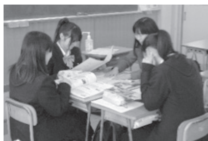
国立大学（文系）説明会

約50校の大学や専門学校等の関係者をお迎えし、生徒たちは希望の学校の学部・学科や職種に分かれ、それぞれの進路希望に応じてガイダンスを受けることにより有用な情報を得ていた様子でした。