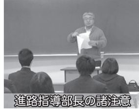
進路指導部長の諸注意