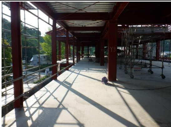
3階「議場前廊下」(令和2年8月26日撮影)