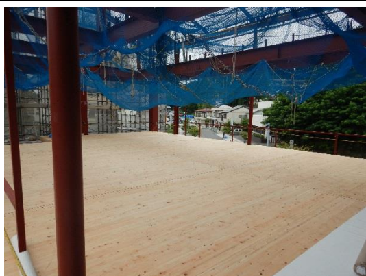
2階「桜ホール」(令和2年7月10日撮影)