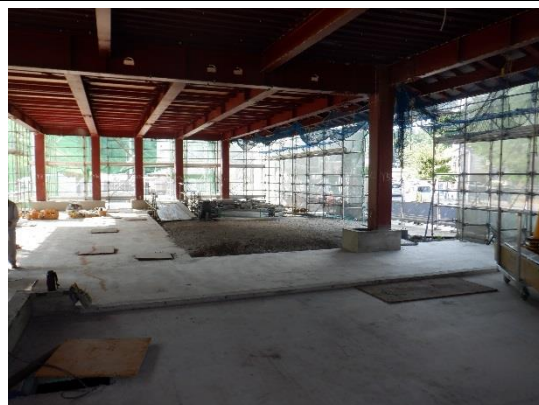
1階「ピロティ」(令和2年8月26日撮影)