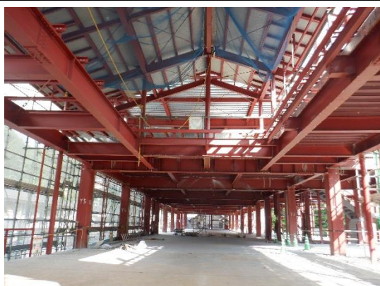
2階「桜ホール」(令和2年8月26日撮影)