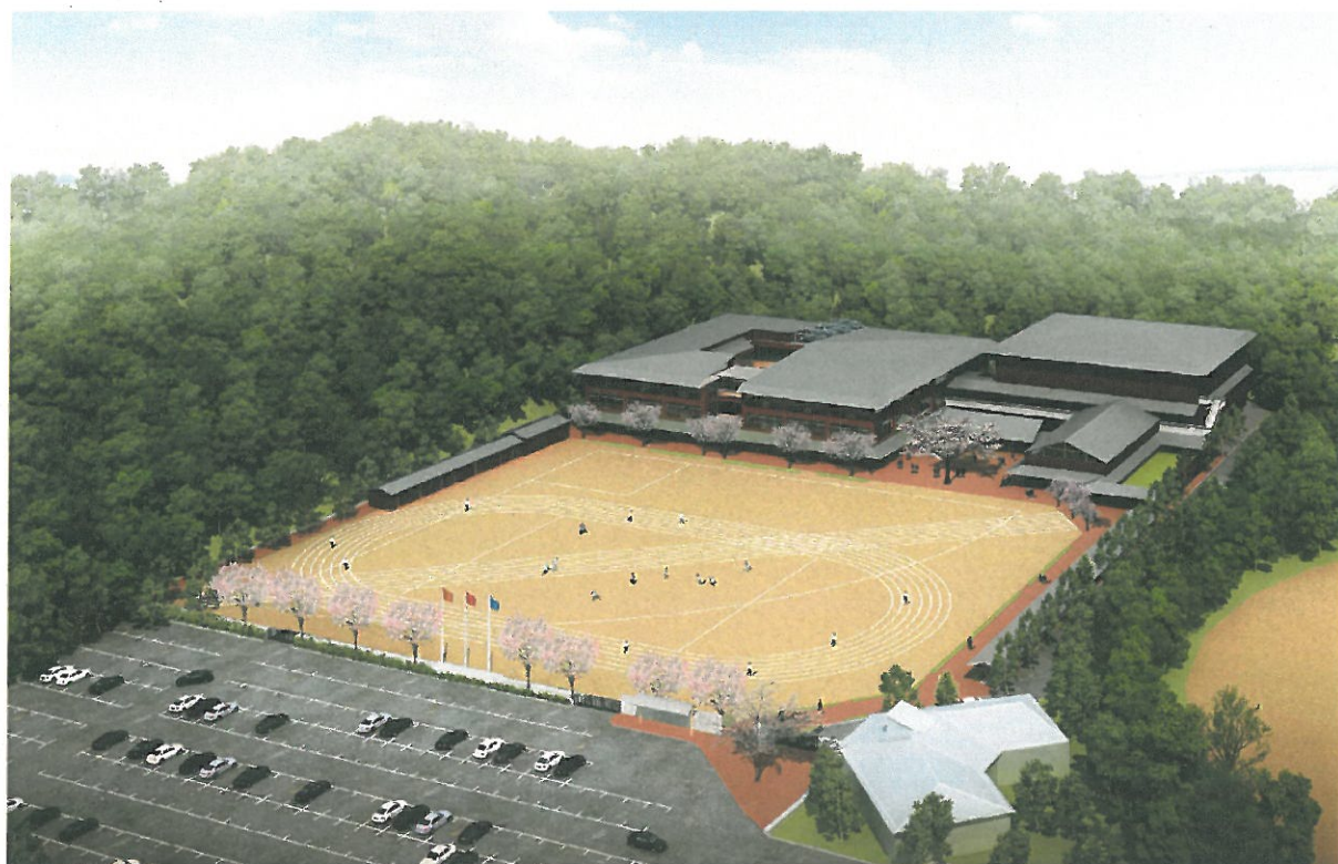
平成25年4月開校予定 新三春中学校完成イメージ