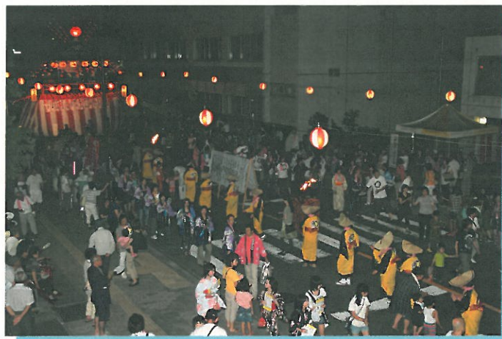
夏の風物詩「三春盆踊り」