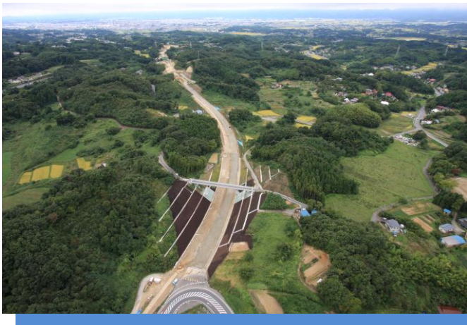
開通間近の国道 288 号 BP