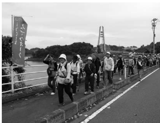
さくら湖を眺めながら、みずウォークを楽しむ参加者のみなさん

参加者の皆さんは、さくら湖の雄大な秋の景色を眺めながら、さわやかな秋風のなか心地よい汗を流していました。ゴール会場の三春の里田園生活館では、お楽しみ抽選会や、温かい三春汁に舌鼓を打つ人々で溢れていました。