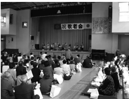
中郷地区敬老会のようす

各地区とも式典に引き続き、さまざまなアトラクションが行われ、保育所・幼稚園児の遊戯や地域のみなさんによる歌や踊りが披露され、大いに盛り上がり、楽しいひと時を過ごしていました。