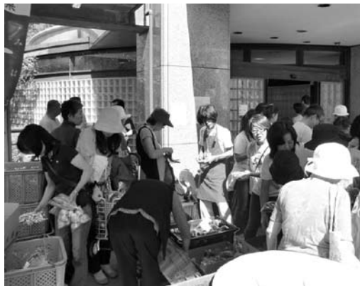
東京目黒区SUNまつりのようす

また、翌週の27日には、目黒区内の学芸大学東口商店街においても三春産の野菜販売を行い、あっといいう間に売り切れました。