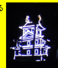
第2回「お城山まつり」の様子

町のシンボルである城址公園の整備・管理を官民協働で行う。整備の効果として、「お城山まつり」が行われる。