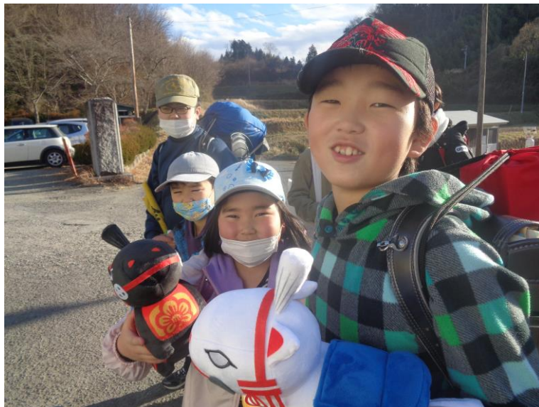
「くろまる・しろすけ」を手にした笑顔の小学生(中妻小)