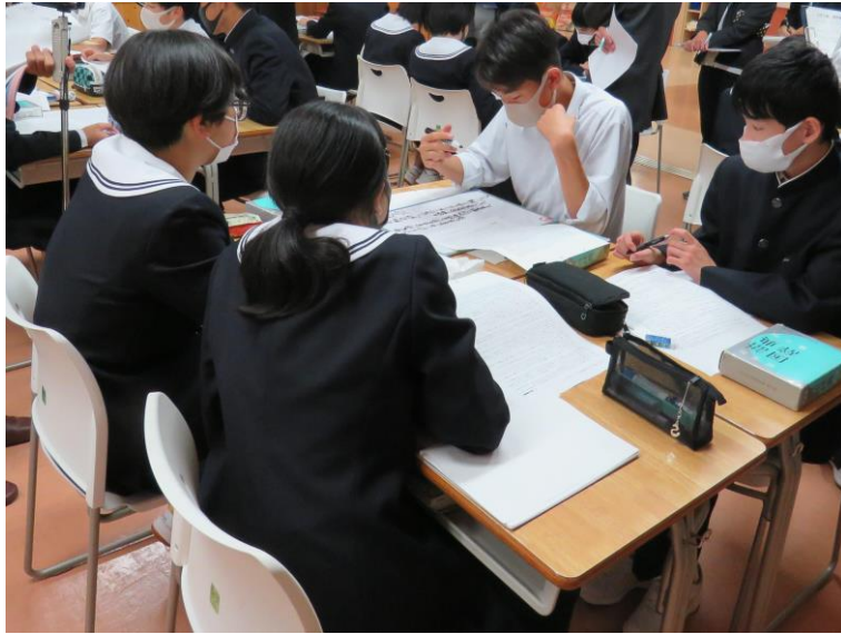
グループ学習で話し合う生徒(三春中)